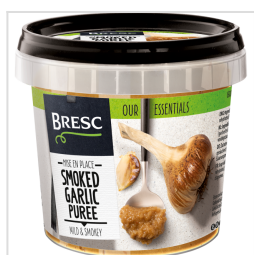
Bresc Geräuchertes Knoblauchpüree 325g