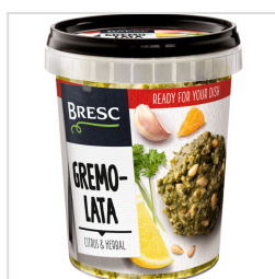
Bresc Gremolata 450g