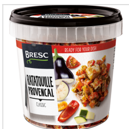
Bresc Ratatouille 1000g