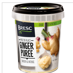
Bresc Purée de gingembre 450g