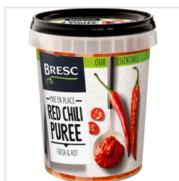
Bresc Purée de piments rouges 450g