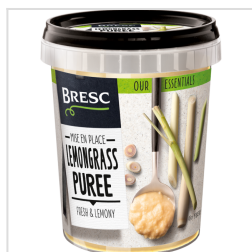
Bresc Purée de citronnelle 450g