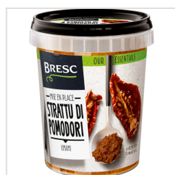
Bresc Purée de tomates séchées au soleil 450g