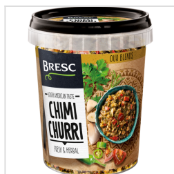
Bresc Chimichurri Mélange d'herbes 450g