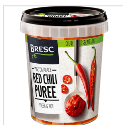
Bresc Purée de piments rouges 450g