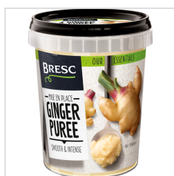
Bresc Purée de gingembre 450g