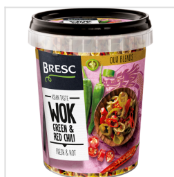
Bresc WOK Piment vert et rouge 450g