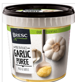
Bresc Purée d'ail 1000g