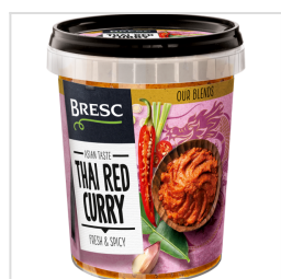
Bresc Curry rouge thaï 450g