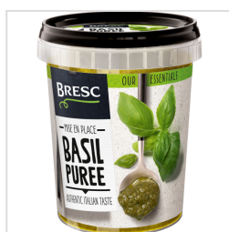
Bresc Purée de basilic 450g