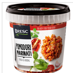
Bresc Tomates émincées et marinées 1000g