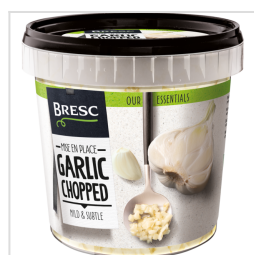
Bresc Ail haché 1000g