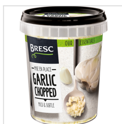
Bresc Ail haché 450g