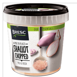
Bresc Échalote hachée 1000g