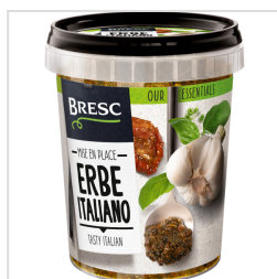
Bresc Herbes italiennes 450g