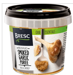
Bresc Purée d'ail fumé 325g