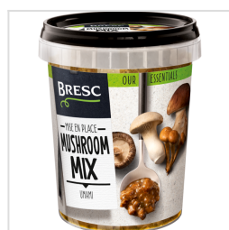
Bresc Mélange de champignons 450g