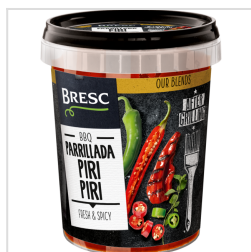
Bresc Parrillada Piri Piri 450g