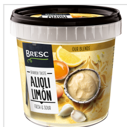
Bresc Aioli au citron 1000g