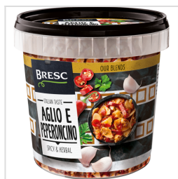
Bresc Aglio e peperoncino 1000g