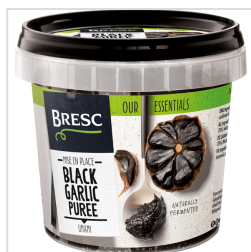
Bresc Purée d'ail noir 325g