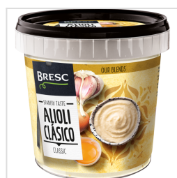
Bresc Aioli 1000g