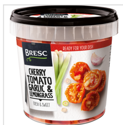
Bresc Tomates cerises à l'aigre-douce, ail et citronnelle 1100g