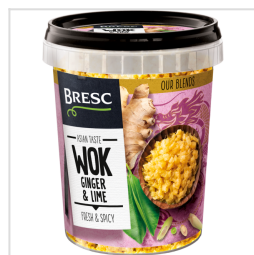
Bresc WOK Gingembre et Citron 450g