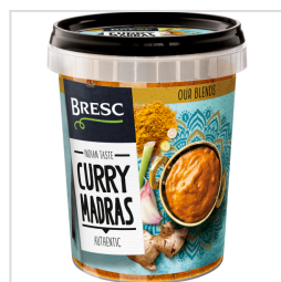
Bresc Madras 450g