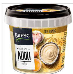
Bresc Aioli 325g