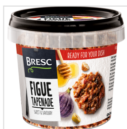
Bresc Tapenade de figues 325g