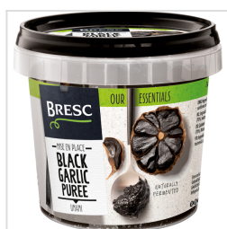
Bresc Purée d'ail noir 325g