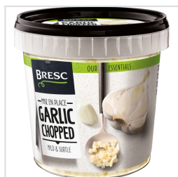
Bresc Ail haché 1000g