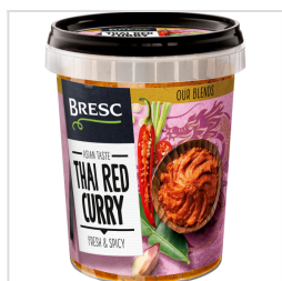
Bresc Curry rouge thaï 450g