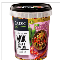
Bresc WOK Piment vert et rouge 450g