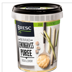
Bresc Purée de citronnelle 450g