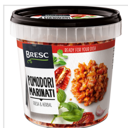
Bresc Tomates émincées et marinées 1000g