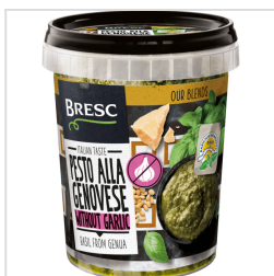
Bresc Pesto alla Genovese sans ail 450g