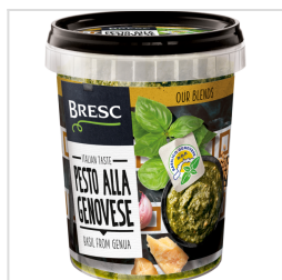
Bresc Pesto alla Genovese 450g