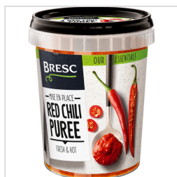
Bresc Rode peperpuree 450g