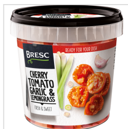
Bresc Zoetzure cherrytomaten knoflook citraengras 1100g