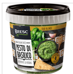
Bresc Pesto van basilicum 1000g