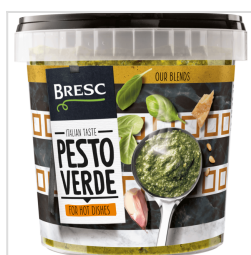
Bresc Groene pesto 1000g