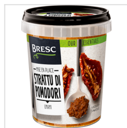
Bresc Zongedroogde tomatenpuree 450g