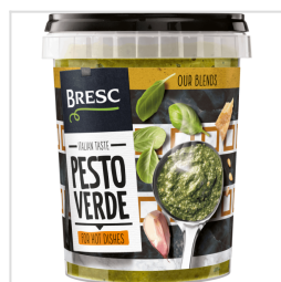
Bresc Groene pesto 450g