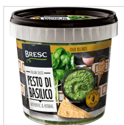
Bresc Pesto van basilicum 1000g