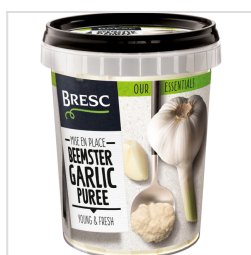
Bresc Nederlandse knoflookpuree uit de Beemster 450g