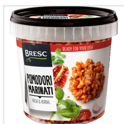
Bresc Gemarineerde tomatenstukjes 1000g