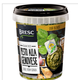
Bresc Pesto alla Genovese 450g