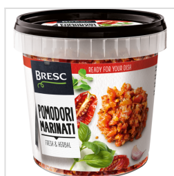
Bresc Gemarineerde tomatenstukjes 1000g