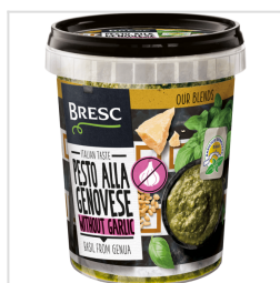
Pesto alla Genovese zonder knoflook 450g