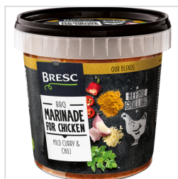
Bresc Marinade voor kip 1000g