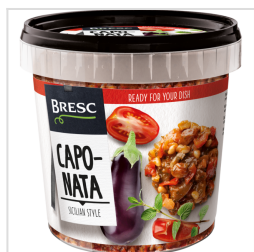
Bresc Caponata 1000g