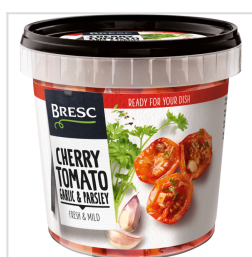
Bresc Zoetzure cherrytomaten knoflook peterselie 1100g