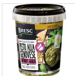
Bresc Pesto alla Genovese zonder knoflook 450g