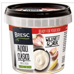
Bresc Alioli Clásico 325g