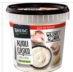
Bresc Alioli Clásico 1000g