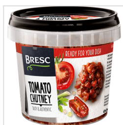
Bresc Tomaten chutney 325g