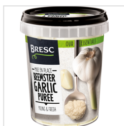
Bresc Nederlandse knoflookpuree uit de Beemster 450g