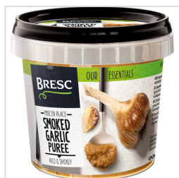
Bresc Gerookte knoflookpuree 325g