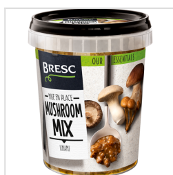
Bresc Paddenstoelenmix 450g