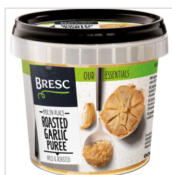
Bresc Geroosterde knoflookpuree 325g