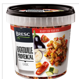
Bresc Ratatouille 1000g