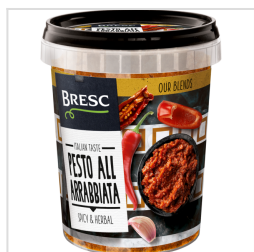
Bresc Pesto all'Arrabiata 450g