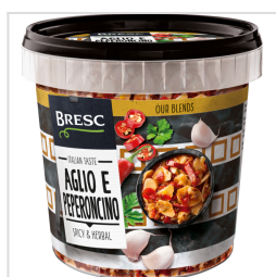
Aglio e peperoncino 1000g