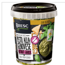
Bresc Pesto alla Genovese zonder knoflook 450g