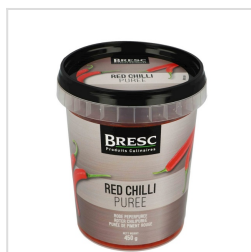
Rode peperpuree 450g